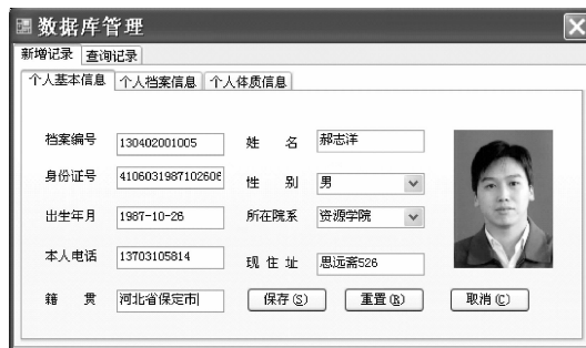
图3 师生健康档案库