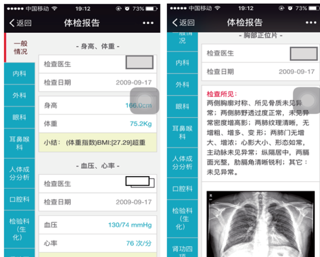
图 4 微信版体检报告